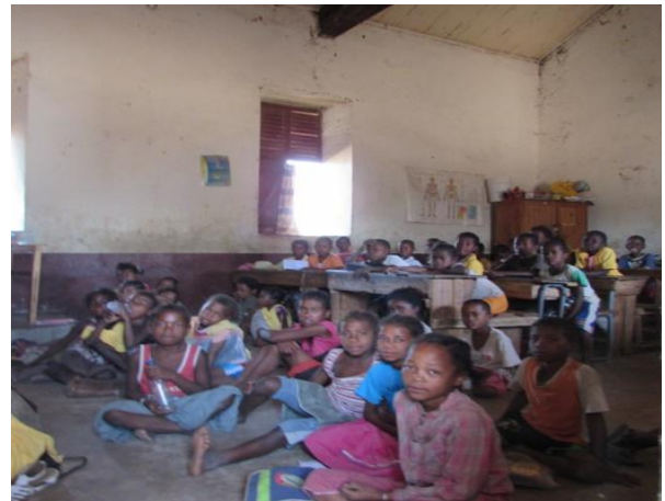
Ecole Primaire Publique de Tsihombe