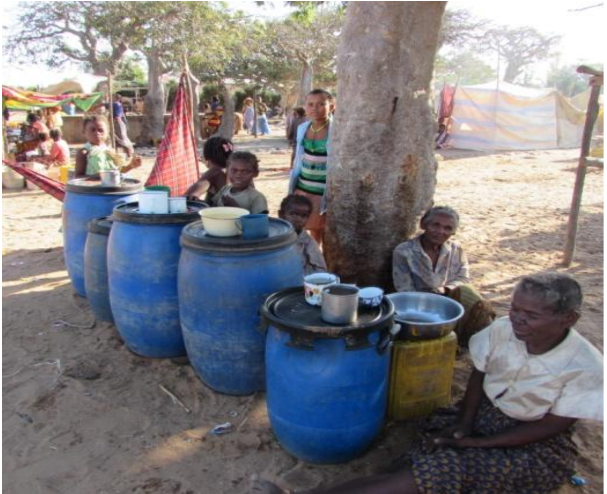
Point de vente d'eau potable

D'autres problèmes dépassant le cadre des droits de l'enfant ont également été évoqués :