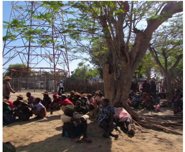
Distribution d'aide par les ONG