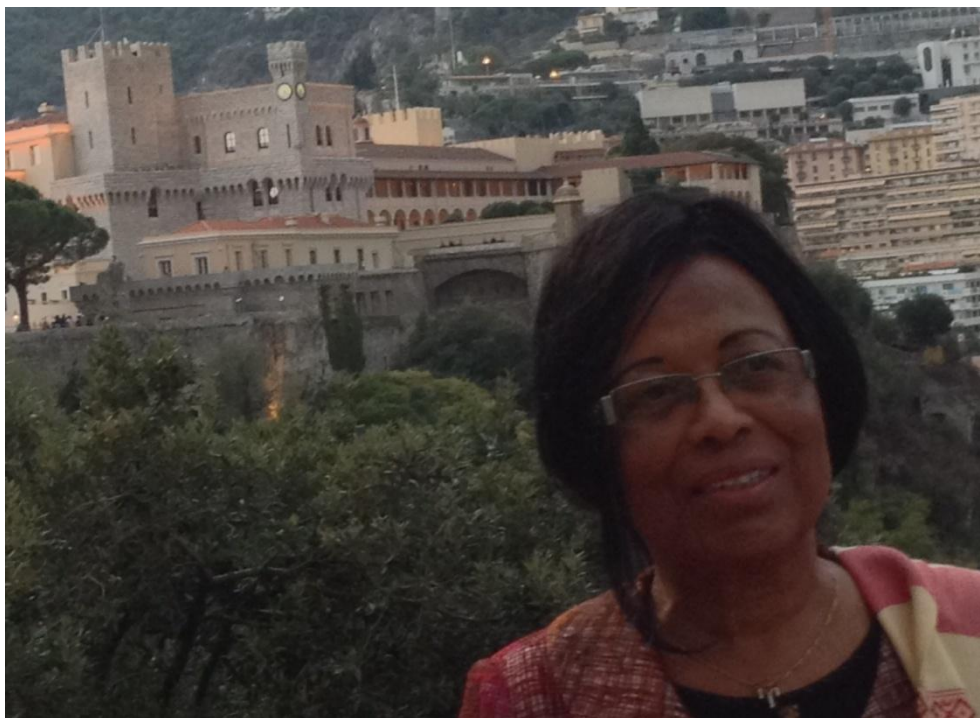
Le Palais Princier de Monaco en arrière plan

Le séminaire avait pour thème : « Les Ombudsmans/Médiateurs et les INDH, relations avec les instances onusiennes. Il a pour principal objectif de réfléchir sur les voies et moyens vers l'accréditation des ombudsmans/médiateurs auprès du Comité de coordination des Institutions Nationales des Droits de l'Homme (INDH), ainsi que l'octroi à ces derniers de la compétence de soumettre des observations dans le cadre du mécanisme d'Examen Périodique Universel.