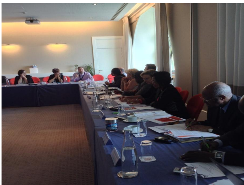
Des participants à l'atelier de Monaco

Le séminaire avait pour thème : « Les Ombudsmans/Médiateurs et les INDH, relations avec les instances onusiennes. Il a pour principal objectif de réfléchir sur les voies et moyens vers l'accréditation des ombudsmans/médiateurs auprès du Comité de coordination des Institutions Nationales des Droits de l'Homme (INDH), ainsi que l'octroi à ces derniers de la compétence de soumettre des observations dans le cadre du mécanisme d'Examen Périodique Universel.