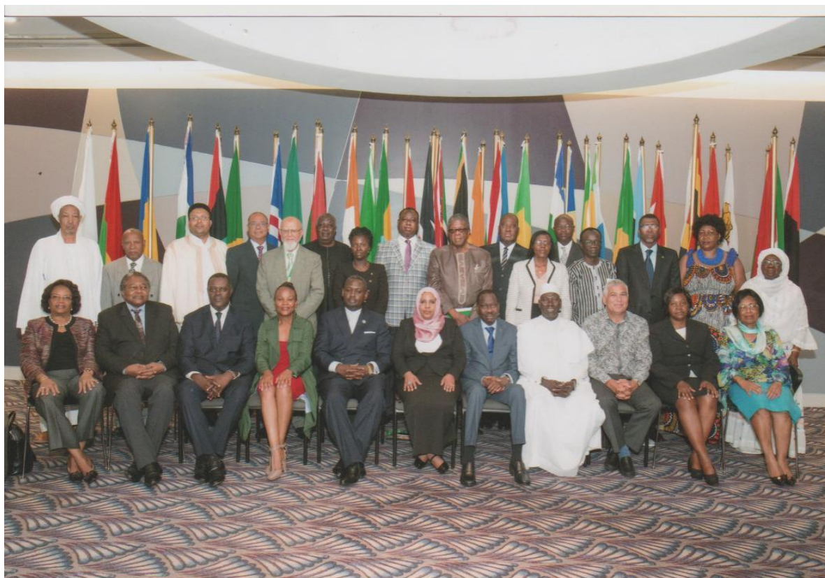
Photo de famille des Médiateurs/Ombudsmans africains à l'Assemblée Générale de l'AOMA tenue à Durban