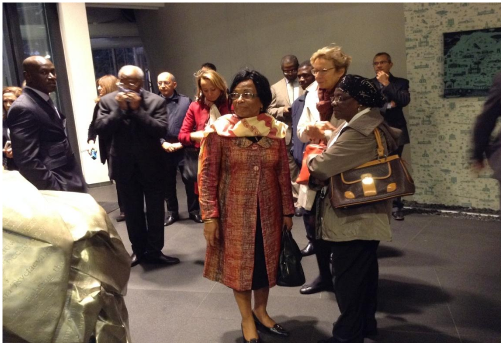
Visite de la salle du Parlement

Le Médiateur de Madagascar a pu rencontrer pendant cette période le Prince de Monaco. Pendant les échanges, il a dit qu'il serait à Madagascar au mois de septembre 2016 mais ne pourra participer au Sommet de l'OIF en novembre 2016.