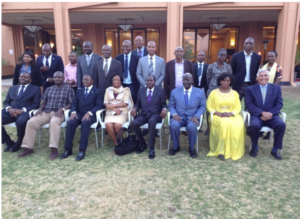
Les délégués réunis aux travaux du Comité Exécutif de l'AOMA à Windhoek, Namibie

La 11 e réunion du Comité exécutif de l'AOMA s'est tenue à Windhoek, Namibie, le 30 août 2016 à laquelle ont participé le Médiateur de la République et un membre de son cabinet. Il s'agit d'une réunion statutaire de l'organisation. Elle a été dirigée par le 1 e Vice-président de l'organisation, à l'issue de laquelle a été décidé que la 5 e Assemblée Générale de l'AOMA se tiendra la première semaine de novembre 2016 à Durban, en Afrique du Sud.